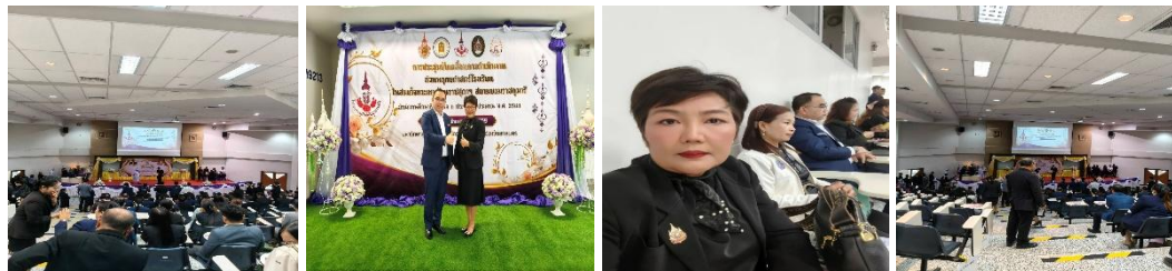
19. โครงการติดตามและประเมินผลแผนพัฒนาองค์การบริหารส่วนจังหวัดสกลนคร