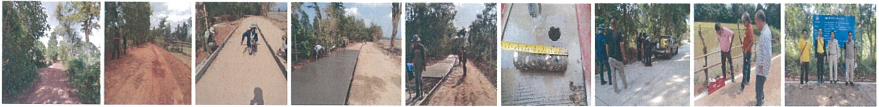
26. โครงการสายมะขามป้อม หมู่ที่ 5 เขตเทศบาลตำบลธาตุนาเวง – ชุมชนมะขามป้อม(ซอยขวัญตาล)เขตเทศบาลสกลนคร ตำบลธาตุเชิงชุม อำเภอเมืองสกลนคร