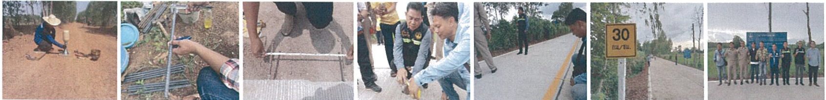
31. โครงการซ่อมสร้างและเสริมผิวจราจรแอสฟัลต์ติกคอนกรีต สายบ้านเชียงสือ หมู่ที่1 ตำบลเชียงสือ อำเภโพนนาแก้ว อำเภโพนนาแก้ว จังหวัดสกลนคร - บ้านใหม่ไทยเจริญ หมู่ที่9 ตำบลยอดขาด อำเภอวังยาง จังหวัดนครพนม