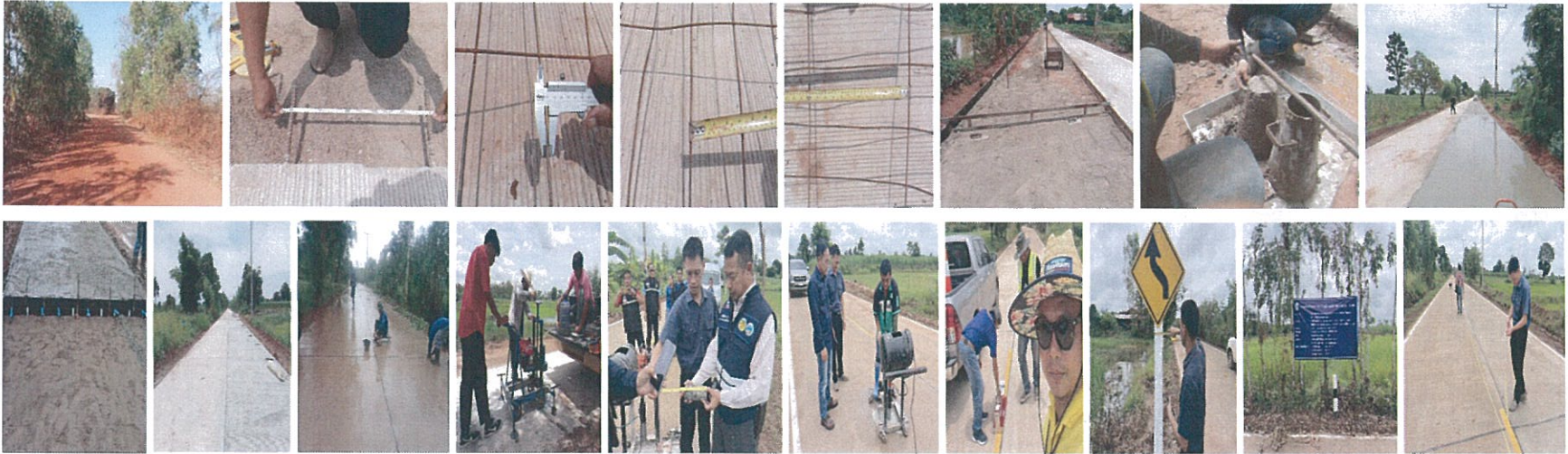
19. โครงการก่อสร้างถนนคอนกรีตเสริมเหล็กสายบ้านนาดี หมู่ที่ 7 ตำบลนาหัวบ่อ – บ้านไร่ หมู่ที่ 1 ตำบลไร่ อำเภอพรรณานิคม จังหวัดสกลนคร