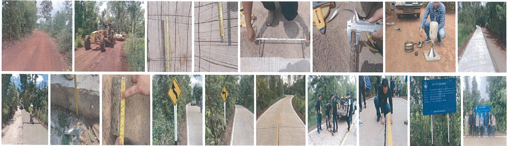
17. โครงการก่อสร้างถนนคอนกรีตเสริมเหล็กสายบ้านนวมแห่งใหญ่ หมู่ที่ 2 บ้านคำเจริญ หมู่ที่ 5 บ้านหนองบัวแพ หมู่ที่ 7 ตำบลบ้านถ่อน อำเภอสว่างแดนดิน - บ้านหนองจาน หมู่ที่ 6 ตำบลทุ่งแก อำเภोजริญศิลป์ จังหวัดสกลนคร