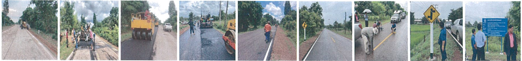
34. โครงการซ่อมสร้างและเสริมผิวจราจรแอสฟัลต์ติกคอนกรีตสายบ้านดงคำโพธิ์ หมู่ที่ 11 ตำบลปลาไหล อำเภวาริชภูมิ – บ้านหนองบัว หมู่ที่ 4 ตำบลแร่ อำเภอฟังโคน จังหวัดสกลนคร