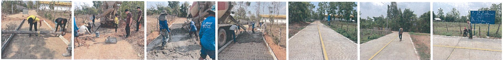
27. โครงการก่อสร้างถนนคอนกรีตเสริมเหล็กสายบ้านสร้างแก้ว หมู่ที่ 5 ตำบลสร้างก่อ – บ้านหลุบเลา หมู่ที่ 1 ตำบลหลุบเลา อำเภอภูพาน จังหวัดสกลนคร