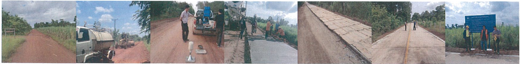
30. โครงการก่อสร้างถนนคอนกรีตเสริมเหล็ก สายบ้านคำไชยวาน หมู่ที่ 5 ตำบลบ้านต้าย - บ้านหนองกุง หมู่ที่ 7 ตำบลบงใต้ อำเภอสว่างแดนดิน จังหวัดสกลนคร