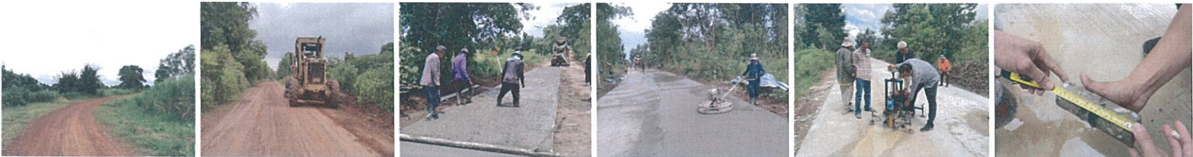
20. โครงการก่อสร้างถนนคอนกรีตเสริมเหล็กสาย สน.2009 บ้านดงบัง - บ้านโพธิ์ทอง อำเภอเจริญศิลป์, อำเภอบ้านม่วง จังหวัดสกลนคร