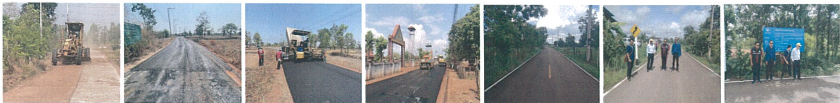
32. โครงการซ่อมสร้างและเสริมผิวจราจรแอสฟัลต์ติกคอนกรีตสายบ้านหนองปลิง หมู่ที่ 5 ตำบลหนองปลิง - บ้านห้วยเหล็กไฟ หมู่ที่ 1 ตำบลนิคมน้ำอูน อำเภอนิคมน้ำอูน จังหวัดสกลนคร