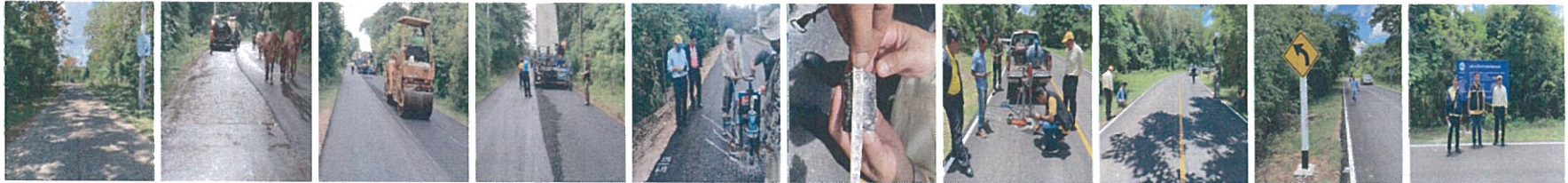
35. โครงการซ่อมสร้างและเสริมผิวจราจรแอสฟัลต์ติกคอนกรีตสาย สน.2041 บ้านหนองสามขา- บ้านท่าแร่ อำเภอกาฬกาน อำเภอนาย จังหวัดสกลนคร